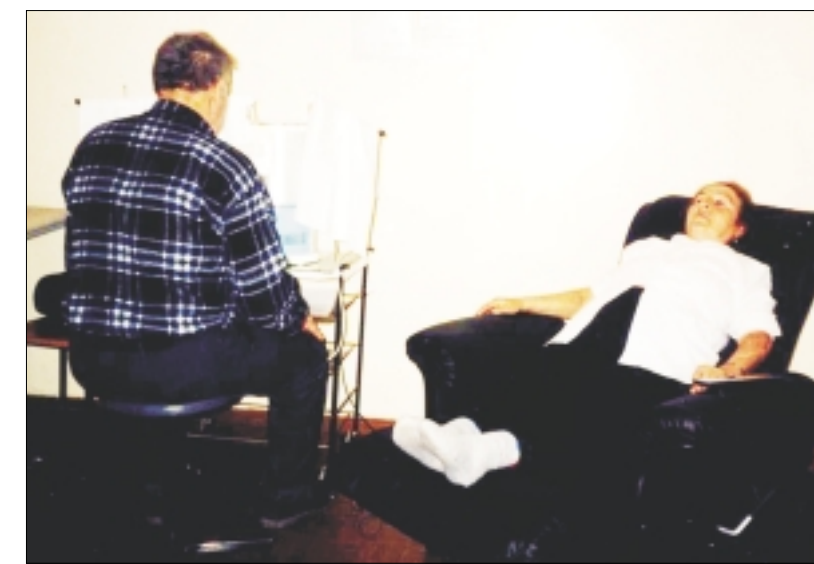
Скоро и жильцы Маслянинского дома-интерната смогут поправить здоровье на современном медицинском оборудовании.

В этом году из бюджета Пенсионного фонда РФ на мероприятия в рамках Социальной программы выделено 12 956 720 рублей. Из них 8 с половиной миллионов рублей будут предоставлены на