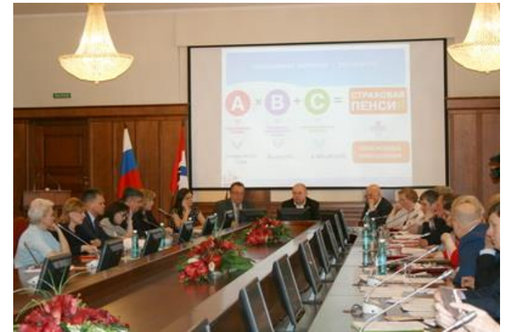
На заседании Комитета его участники познакомились с пенсионной формулой

Для возникновения права на установление страховой пенсии по старости, разъяснила докладчик, необходимо соблюдение определенных условий: достижение возраста, а также наличие минимального страхового стажа и количества пенсионных баллов. Если условия не соблюдены - право на страховую пенсию не возникает. По итогам прошлого года по причинам недостатка минимального количества стажа и пенсионных коэффициентов (например, человек не был официально трудоустроен) органами ПФР