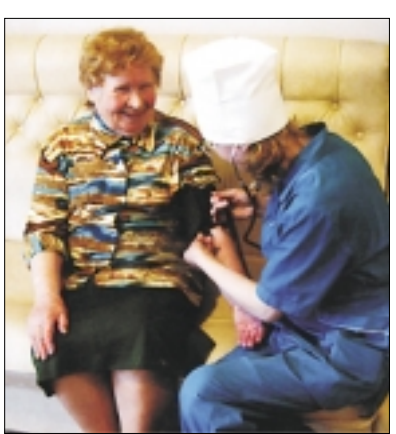
Подготовлено Новосибирским региональным отделением ФСС.

— Фонд социального страхования РФ осуществляет оплату проезда льготных категорий граждан к месту санаторно-курортного лечения и обратно только на междугородном транспорте. Талоны для проезда междугородным транспортом к месту санаторно-курортного лечения и обратно выдаются одновременно с путевкой, а затем обмениваются в кассах вокзала на билеты.