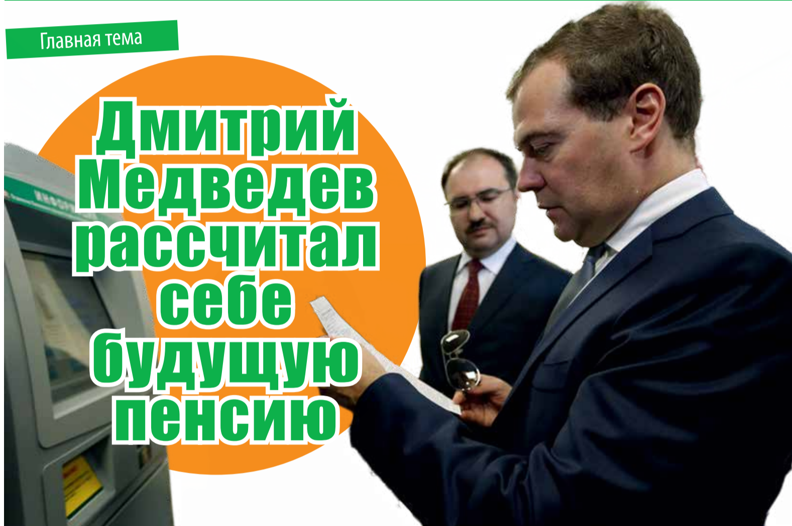
Премьер-министр РФ Дмитрий Медведев и глава Пенсионного фонда РФ Антон Дроздов в УПФР по Благовещенскому району и городу Благовещенск

Министерство труда и социального развития РФ совместно с Пенсионным фондом России разработало пенсионный калькулятор для условного расчета размера будущей пенсии. Это расчет в ценах 2013 года по действующей пенсионной формуле и в соответствии с новыми правилами исчисления трудовой пенсии по старости. Правила в настоящее время разрабатываются Министерством в рамках реализации Стратегии дол-