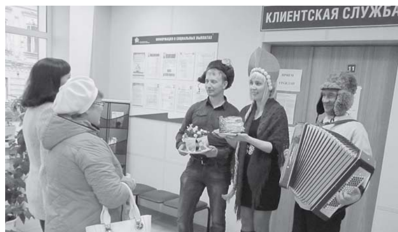
Управление ПФР в Нолинском районе встречает своих клиентов

ют глаз посетителей. В масленичную неделю здесь пекут вкусные блины и оладушки, которыми угощают всех желающих. Уже стало доброй традицией оформлять клиентские службы к праздникам с помощью природных материалов (цветов, листьев, овощей, фруктов и т. д.). Позитивная атмосфера гарантирована!