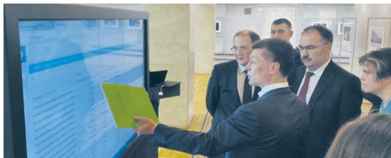
Председатель Правления ПФР Антон Дроздов представляет заместителю Правительства РФ Ольге Голодец, Министру труда и социальной защиты Максиму Топилину и представителям субъектов РФ Федеральную государственную информационную систему «Федеральный реестр инвалидов»

В ходе следующего этапа – в 2017 году – предстоит выполнить целый ряд важных задач. В частности, запланированы мероприятия по расширению нормативно-правовой базы, что позволит оказывать инвалидам государственные и муниципальные услуги на основании сведений из федерального реестра без запроса у других ведомств и самих инвалидов дублирующих документов и сведений. В 2017 году к ФГИС ФРИ произведут подключение все заинтересованные ведомства, в том числе на уровне субъектов РФ. Информационный обмен будет производиться через систему межведомственного элек-