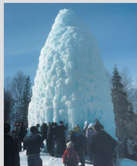
Коллектив УПФР в городе Миассе Челябинской области с родными и близкими

Уже более сорока лет в этом месте из земли бьет фонтан. Замерзая, он образует причудливую сосульку из голубого льда высотой до 16 метров. Хрустальный купол представляет действительно незабываемое зрелище. Особенно впечатляет фонтан ближе к концу зимы, когда максимально замерзает и наиболее высок. Каждый год хрустальный купол разный. Над формой «ледяной