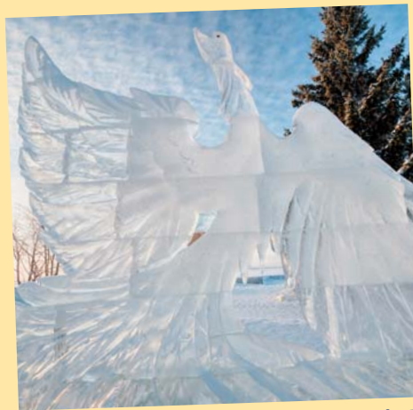
Коллектив ОПФР по Архангельской области

Тематика ледовых чудес в 2018 году посвящена празднованию 325-летия начала государственного судостроения в России.